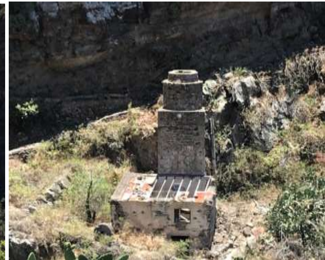
MOLINO DE AGUA