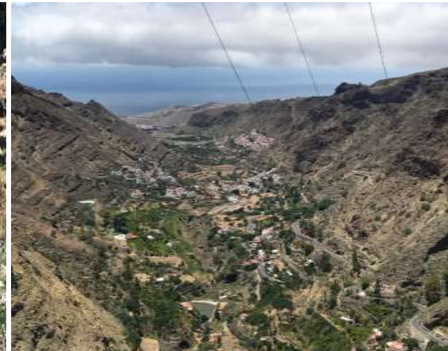
VALLE DE AGAETE